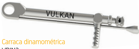
Carraca dinamoétrica VDIN2

VSK2- CON-T Carraca Dinamométrica VDIN Drivers Conexión 4x4 Topes Incluidos