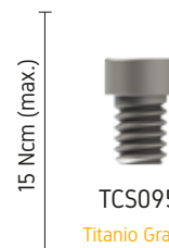
TCS0956 Titanio Grado 5